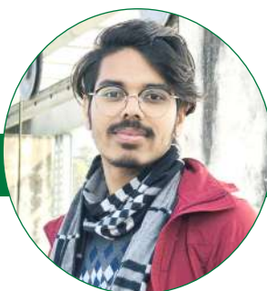
विश्वबन्धु आचार्य स्नातक तह २०७४-०७८ समूह प्राप्ताङ्क ८५.२०%